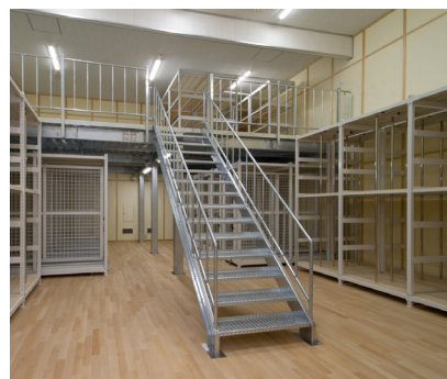
貴重な作品を保管する収蔵庫