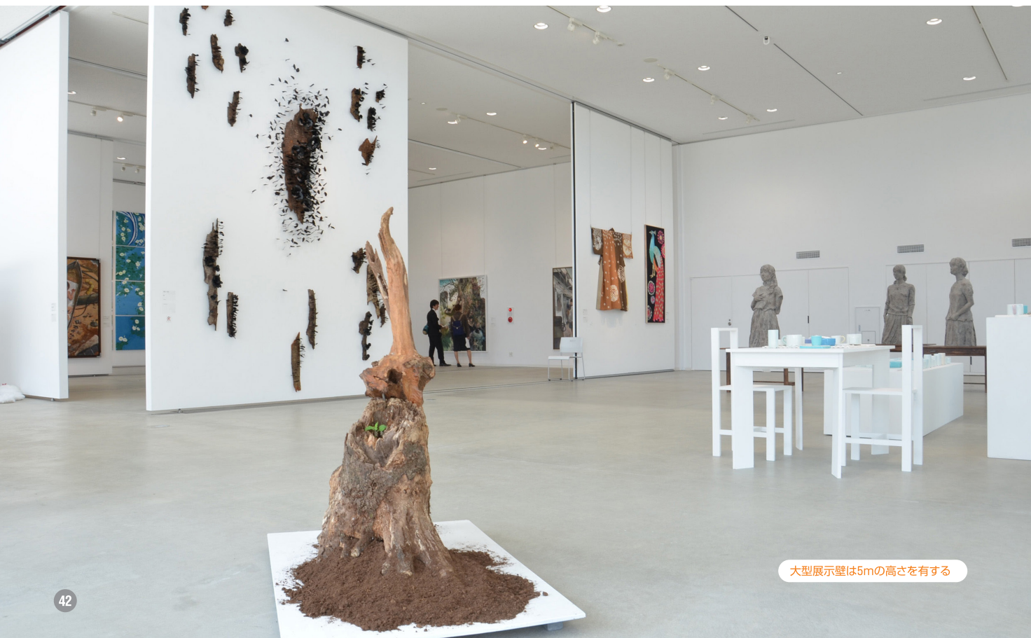
大型展示壁は5mの高さを有する

はい。そのとおりです。佐賀には約 400年前に創業した有田焼をはじめ、唐 津や有田など日本でも有数の陶磁器の 産地があります。また明治期には岡田三 郎助や百武兼行をはじめとした佐賀出 身の画家が日本の近代美術を牽引して きたという歴史があります。佐賀は地理 的にも恵まれた環境にあります。隣接す る大川は家具の一大産地で佐賀とは交 流が深かったそうですし、明治期の近代 美術を支えた久留米出身の画家、青木繁 も佐賀で一時期を過ごしました。こうい