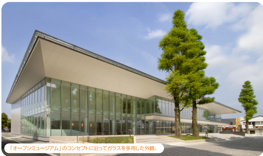
「オープンミュージアム」のコンセプトに沿ってガラスを多用した外観。