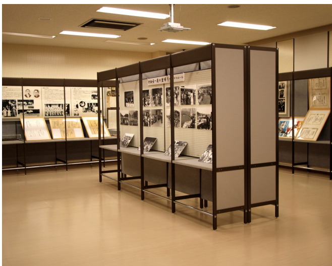
「郷土先達資料室」の展示風景