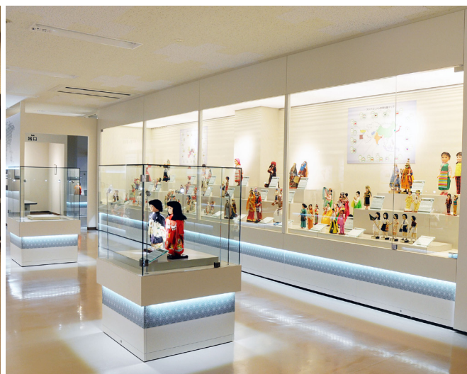
『世界平和大使人形の館』の展示風景