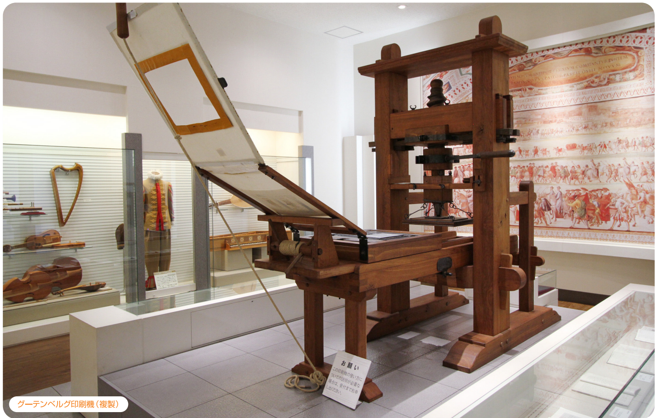
グーテンベルグ印刷機(複製)

それぞれの展示について教えてください。まず『コレジヨ展示室』について、大きなグーテンベルグ印刷機が目を引きますね。