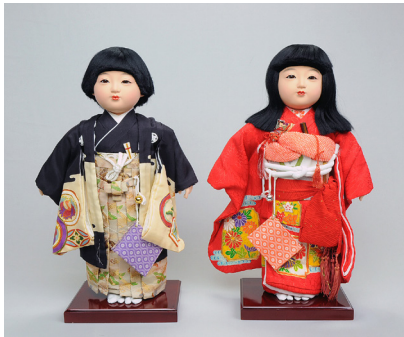
世界中に贈られた市松人形

ではキャプション解説の他、スマートフォンを介した音声解説でも人形の特徴を紹介しています。壁面に埋め込んだタッチパネル式のディスプレイではそれぞれの人形の出身各国の解説や映像が表示されたり、クイズゲームを楽しんだりできます。また、操作画面が上下して、小さな子供や車椅子の方でも扱いやすい、バリアフリーの検索台で楽しく学べる工夫もしています。