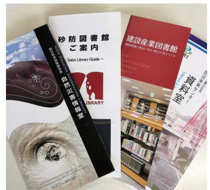
個別の分野のことについては、それぞれの分野の専門図書館などを紹介できるよう、各機関のパンフレットを常備している

ただし、個別の分野のことで専門性を帯びてくると、それぞれの専門機関の方が深い情報をお持ちです。私たちは、どこの機関がどんな資料を持っているかということは、ある程度把握しています。国立研究開発法人防災科学技術研究所の自然災害情報室さん(茨城県つくば市)とは協定を結んでいますし、その他にも土木学会附属図書館さん(東京都新宿区)、建設産業図書館さん(東京都中央区)、砂防図書館さん(東京都千代田区)など、それぞれの分野の専門図書館とは日常的な交流があります。お問い合わせがあれば自館の資料はもちろんのこと、どこの機関に行けばより詳しい資料があるとか、どのサイトを見れば参考になりそうだとか、そういったこともご案内するようにしています。お付き合いのない図書館さんであっても、図書館同士というだけで快く対応していただけることが多く大変助かっています。