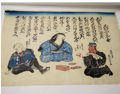
「大都会不尽(おおつゑふし)」 安政の大地震以降のかわら版に見られる絵巻のひとつ

かわら版は現代で言うところの新聞です。当時の災害を克明に記録しているものも多く見られ、過去の災害情報を現代に伝える貴重な資料です。安政年間に多発した「安政の大地震」をはじめとした地震、各地の火災や風水害に関するものを集めています。せっかくのコレクションですので、皆さんに役立てていただこうと、デジタル化した高精細な画像をホームページ上で公開しています。