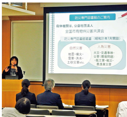
全国図書館大会 平成27年10月16日(日本図書館協会) (同年8月25・26日に実施したインターンシップの報告)

また、防災グッズを販売している一般企業の方から、自社で製作した防災グッズをどこに紹介すればいいかといったご相談を受けて、「震災対策技術展」や「防災産業展」といった防災関係の見本市をご紹介したことがあります。こういった防災関係の見本市には私たち自身も足を運ぶようにしており、そこで得た情報は図書館のレファレンスサービスや企画展にも役立っています。