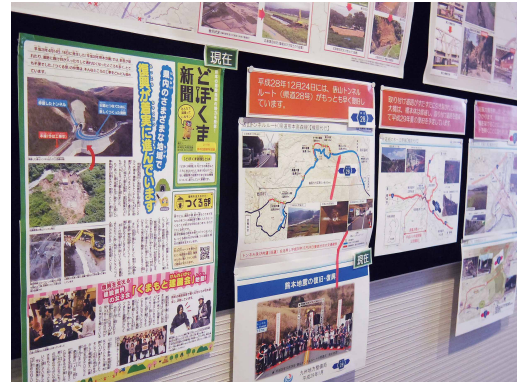
熊本地震で被災した道路の復旧状況を示す「どぼくま新聞」(熊本県発行) 専門的で難しい情報も、子ども向けに発行された資料を掲示するなどして少しでもわかりやすくなるように工夫している

の方が気軽に入って来れるようなところではありません。そこでまずは、ビルの入り口に館名サインを掲示したり、ビルのエントランスの各所に図書館の案内を掲示したりするようにしました。そのことが功を奏してか、ホテルの宿泊客や、会議室の利用者などが図書館の存在に気付いて立ち寄ってくださることが多くなりました。ホテルに宿泊した方がチェックアウト後に立ち寄られたり、その時は時間がなくて立ち寄れなかったものの、次に宿泊されたときに時間調整をしてお越し下さったり。広報活動に力を入れ始めてから利用者の数は年々右肩上がりとなっており、平成25年度と比べて昨年度(平成28年度)はおよそ6倍にまで伸びています。