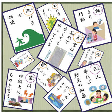
ホームページで公開中の防災いろはかるた2016

他の図書館や業界団体などから防災に関する講演や執筆を依頼されることもあり、そういった場合は積極的にお受けするようにしています。他館の方から「災害に関する企画展の中で防災専門図書館を紹介したいのでパンフレットを送っ