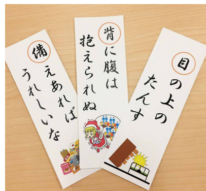
防災いろはかるた しおり版 イベントなどで配布し、好評を博している

私たちは全国で発生する災害の情報をいつも注視しており、被害が大きくなったらすぐにWeb情報や、関連災害の所蔵資料を用意し、現地新聞を一定期間