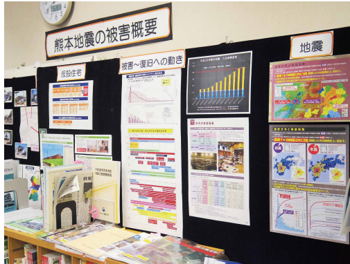
企画展示『熊本地震の被害概要』 (平成29年4月10日～5月31日 好評につき秋口まで展示延長) 入手したデータから独自にグラフを作成するなどして、利用者が理解しやすいような工夫を施している