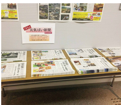
熊本地震被災後の熊本の様子を伝える「くまもと元氣ばい新聞」(熊本日日新聞社発行)