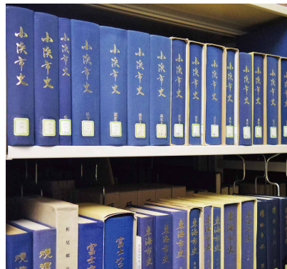
災害の記録は市史の中に埋もれていることも多いため全国の市史も積極的に収集している

当館では、個々の災害の現象に関する資料だけでなくその周辺情報も集めるようにしています。法律に関するもの、ボランティアに関するもの、心のケアに関するもの…など、一つの災害に関して全体を俯瞰して捉えることができる資料群を有しています。一方で、同様の災害であっても事象ごとに細かい分類に振り分けて整理していますので、ある事象をキーに複数の災害を横断して調べられるようになっています。例えば、「液状化」について調べようと思った場合、その分類を見れば、昭和39年の新潟地震の液状化と平成7年の阪神・淡路大震災の液状化を両方比較してみるということもできま