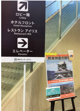
ビルの1階に掲示された企画展のポスター 図書館は8階にあるため、利用者を誘導するための工夫が随所に見られる