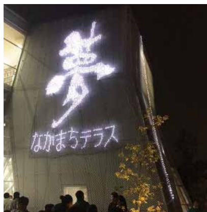
イルミネーション点灯