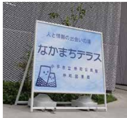
PRのためにLiNKsのメンバーがアイデアを出し合い作成された入口の看板