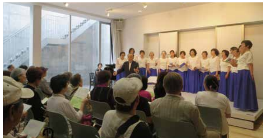
日頃の成果を発表したコーラス

他にも入口の看板作成やイルミネーション点灯もLiNKsのメンバーと協働で実施しました。現在もなかまちテラスを地域の皆で盛り上げているのだという実感があります。