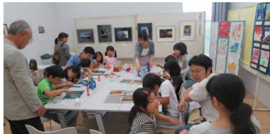
子供たち参加のイベント