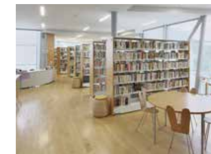
館内のいたる所に椅子がある