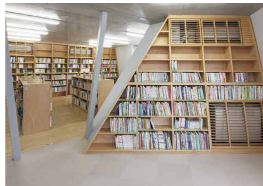
靴を脱いでくつろげる幼児コーナー